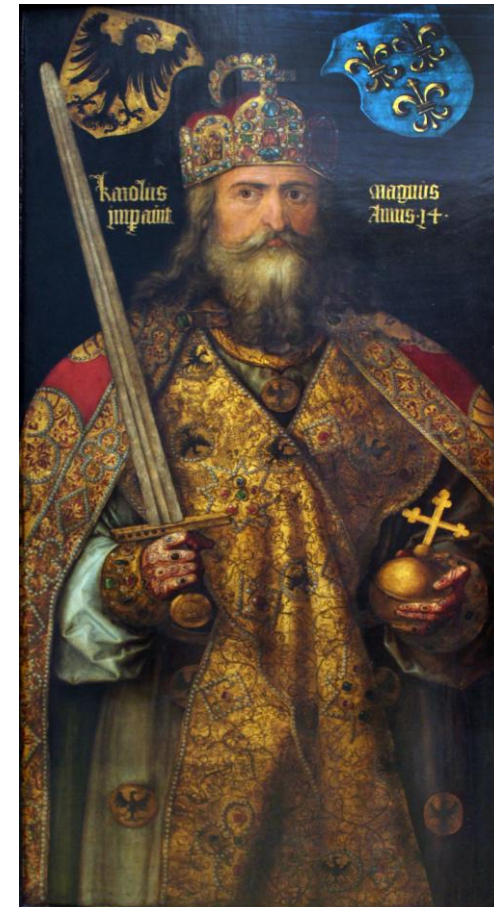
„Kaiser Karl der Große“, Albrecht Dürer, 1512